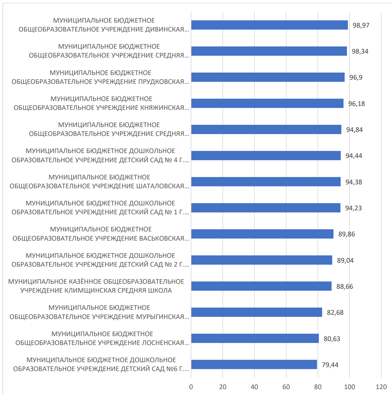
Рисунок 1 – Рейтинг организаций по критерию «Открытость и доступность информации об организации, осуществляющей образовательную деятельность»