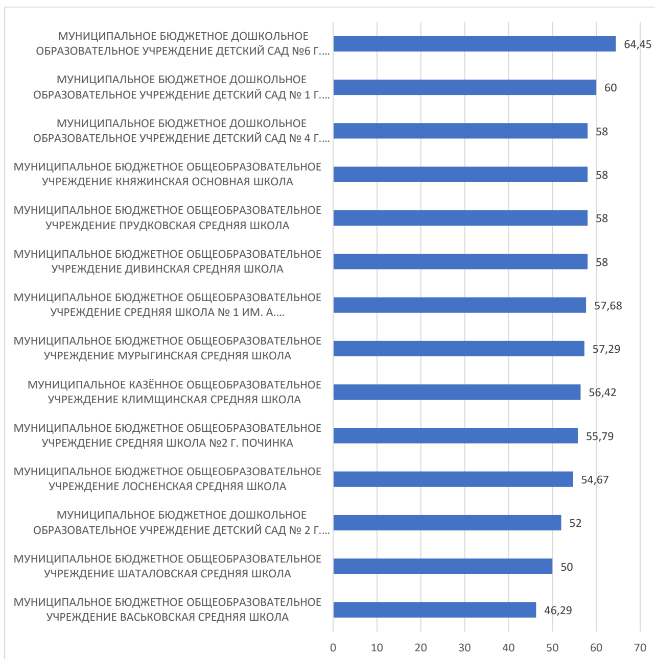
Рисунок 3 – Рейтинг организаций по критерию «Доступность образовательной деятельности для инвалидов»

По третьему критерию «Доступность образовательной деятельности для инвалидов» максимальный результат 64,45 балла набрало МУНИЦИПАЛЬНОЕ