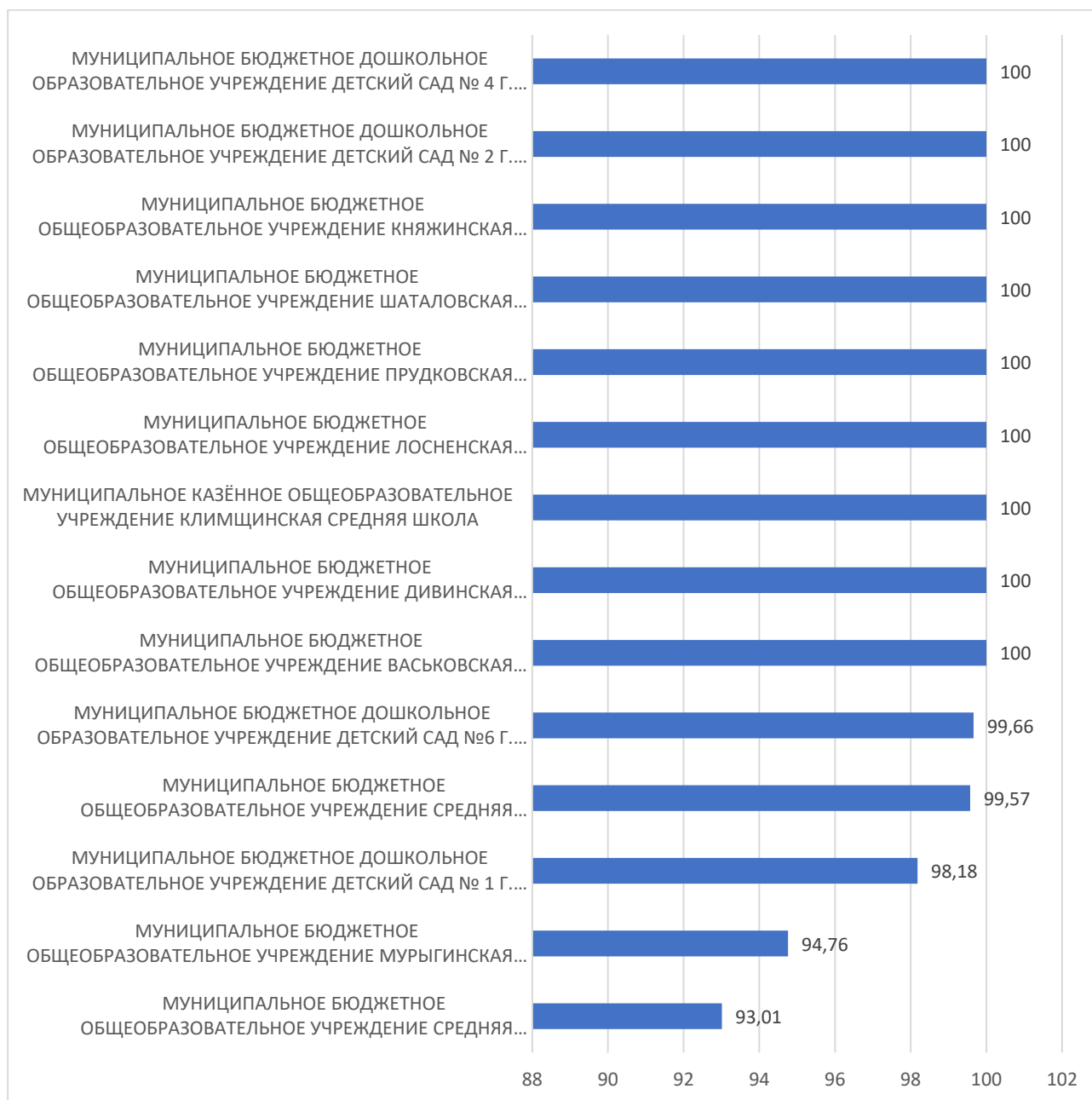
Рисунок 4 – Рейтинг организаций по критерию «Доброжелательность, вежливость работников организации»